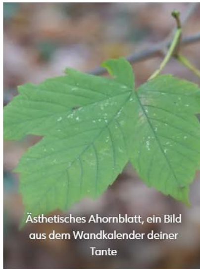
Ästhetisches Ahornblatt, ein Bild aus dem Wandkalender deiner Tante