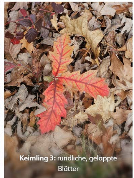
Keimling 3: rundliche, gelappte Blätter