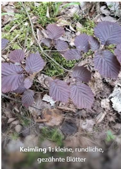
Keimling 1: kleine, rundliche, gezähnte Blätter

Als erstes sollst du herausfinden, um welche Pflanzen es sich handelt. Folgende Keimlinge wurde identifiziert: