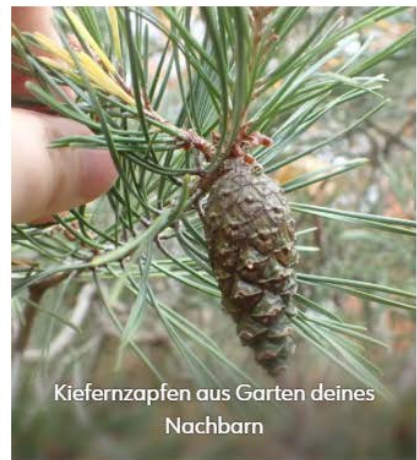
Kiefernzapfen aus Garten deines Nachbarn