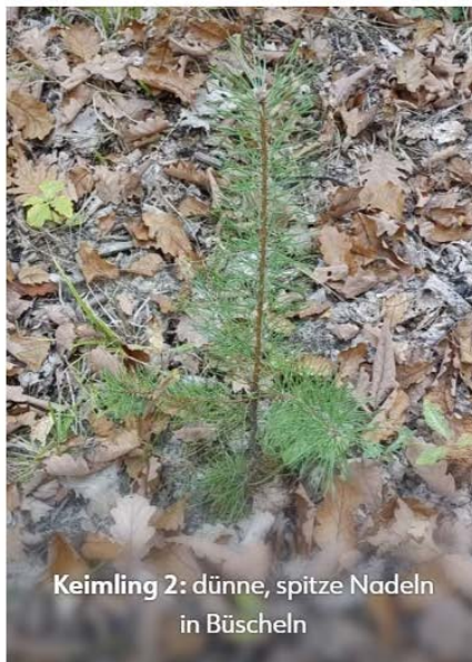
Keimling 2: dünne, spitze Nadeln in Büscheln