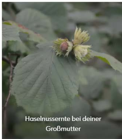
Haselnussernte bei deiner Großmutter