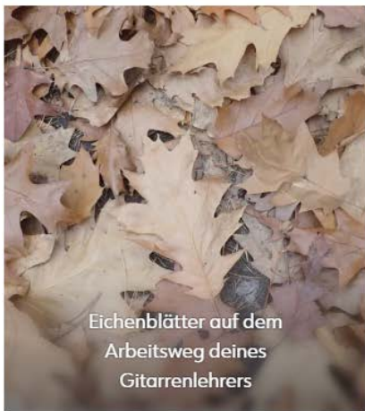
Eichenblätter auf dem Arbeitsweg deines Gitarrenlehrers